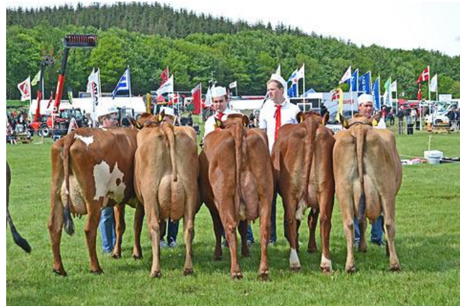
Sommertid og også dyrskuetid.