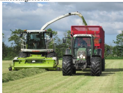
Nu er det lige før, det går løs.....