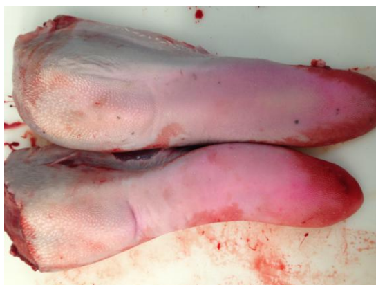
Røde tunger, der kasseres, giver tab, som vi bør kunne undgå.

Sammenlagt løber dette tab op i mange penge.