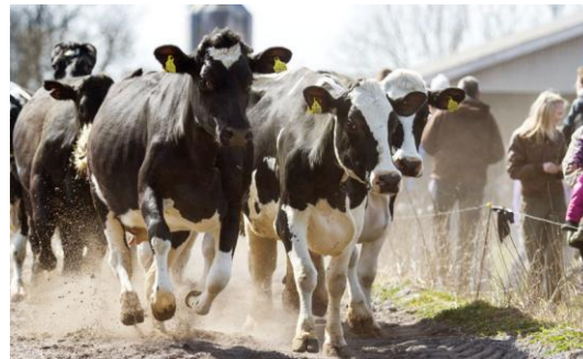
En flok forårskåde kører på vej ud.

Læs mere på http://økodag.dk/find-en-gaard/