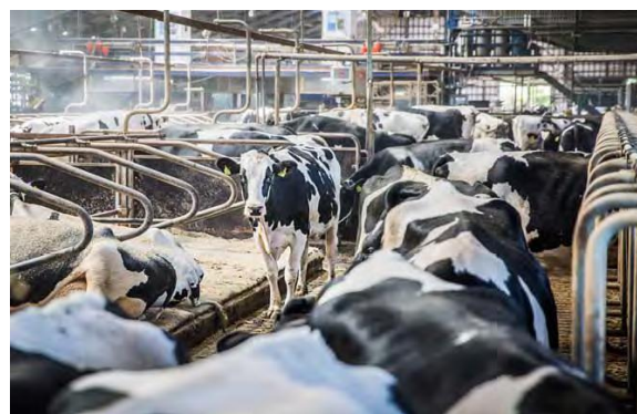
Fra stalden på DKC ved Foulum.